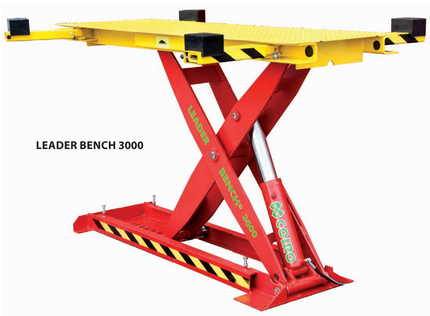
LEADER BENCH 3000