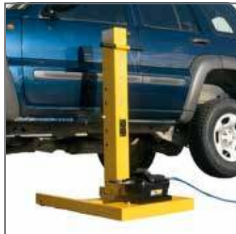
Sollevamento su sottoporta Lifting on the underdoor