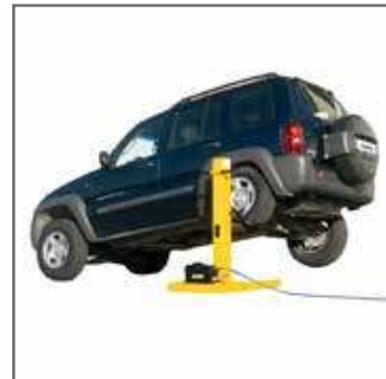
Sollevamento su ruote posteriori Lifting on the rear wheel