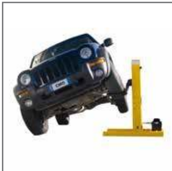
Sollevamento su ruote anteriori Lifting on the front wheel