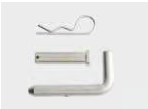
ET38 - ET72