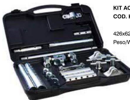
KIT ACCESSORI COD. KET/A/IC 426x620x150 mm Peso/Weight: 20 Kg