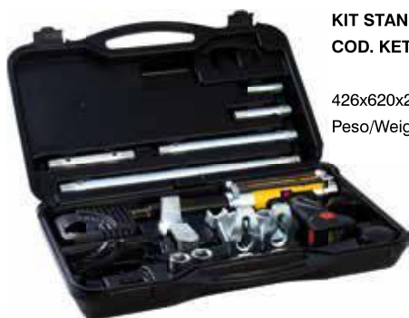
KIT STANDARD COD. KET/IC 426x620x210 mm Peso/Weight: 18 Kg